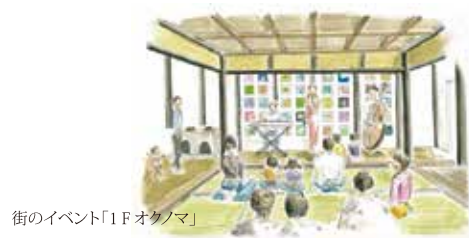
街のイベント「1Fオクノマ」