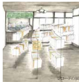
レコードの展示スペース「ナカノマ」